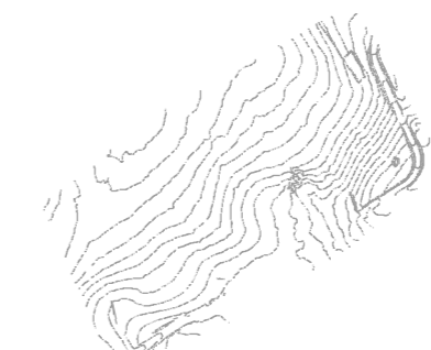
Altimetria 2 x 2 m