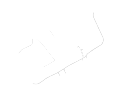
Rede viária e outras construções lineares